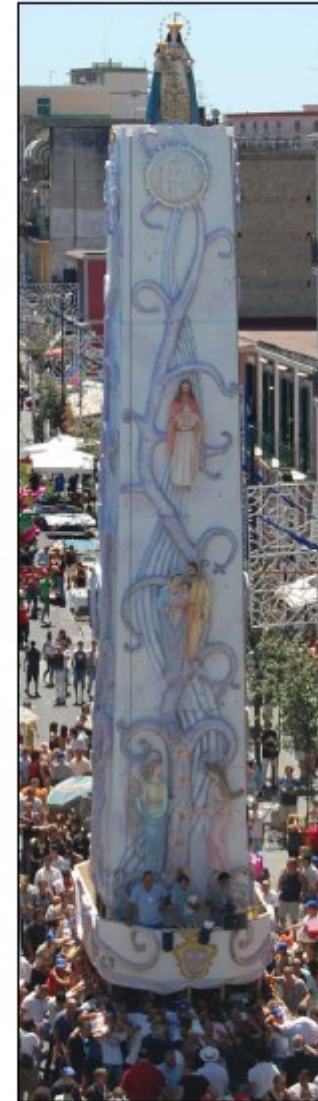
Decorazione "Carro 2008"