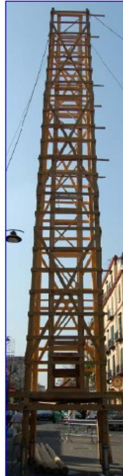
Scheletro macchina da festa