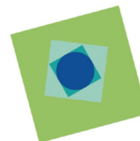
Targa Rodolfo Bonetto