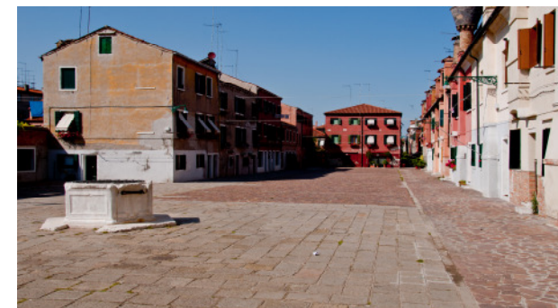
Corte dei Cordami