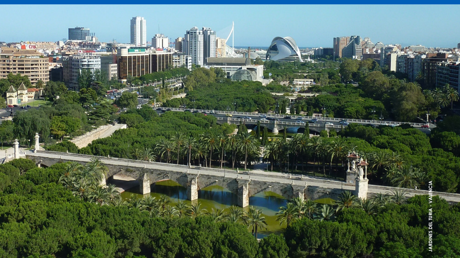
JARDINES DEL TURIA - VALENCIA

MASTER EUROPEO DI SECONDO LIVELLO RIGENERAZIONE URBANA