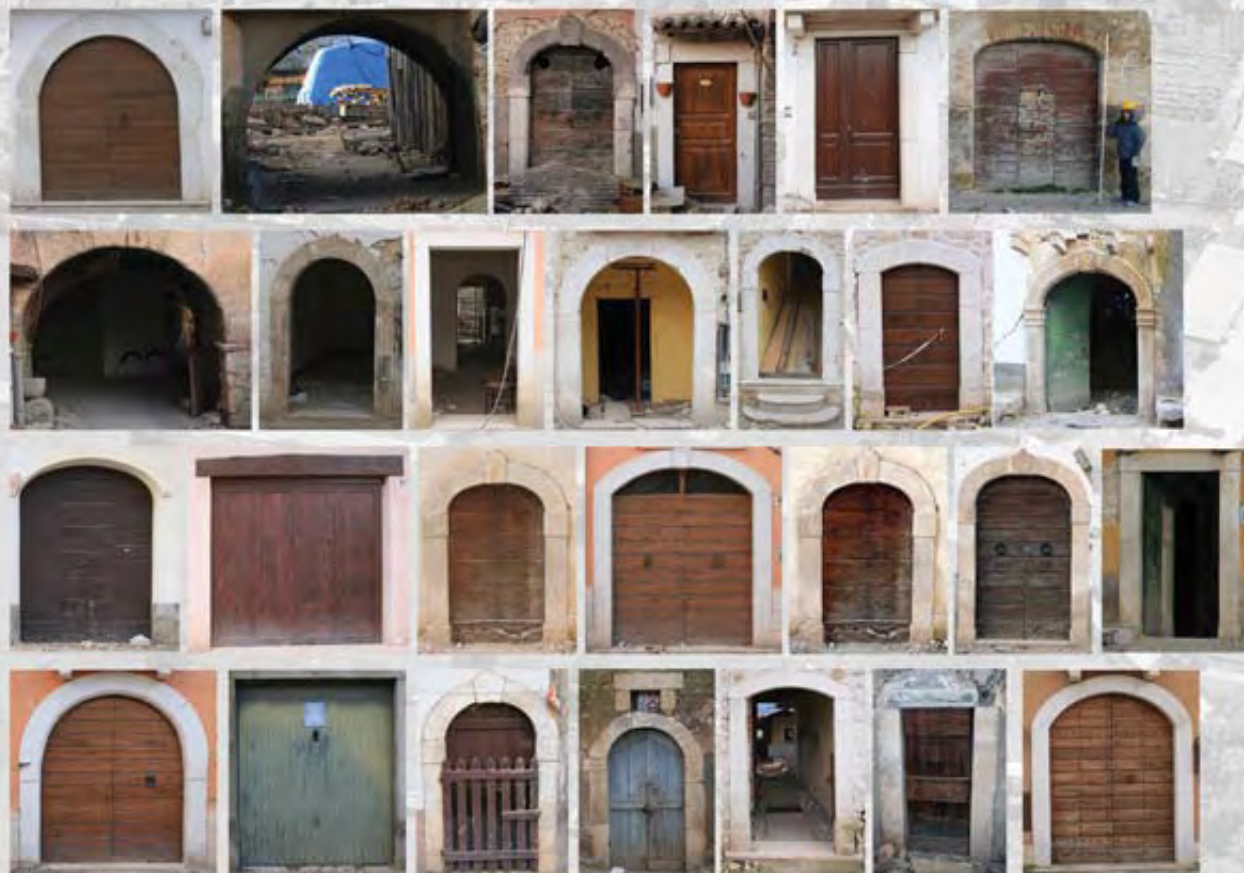
Alcuni esempi di porte e portali onnesi