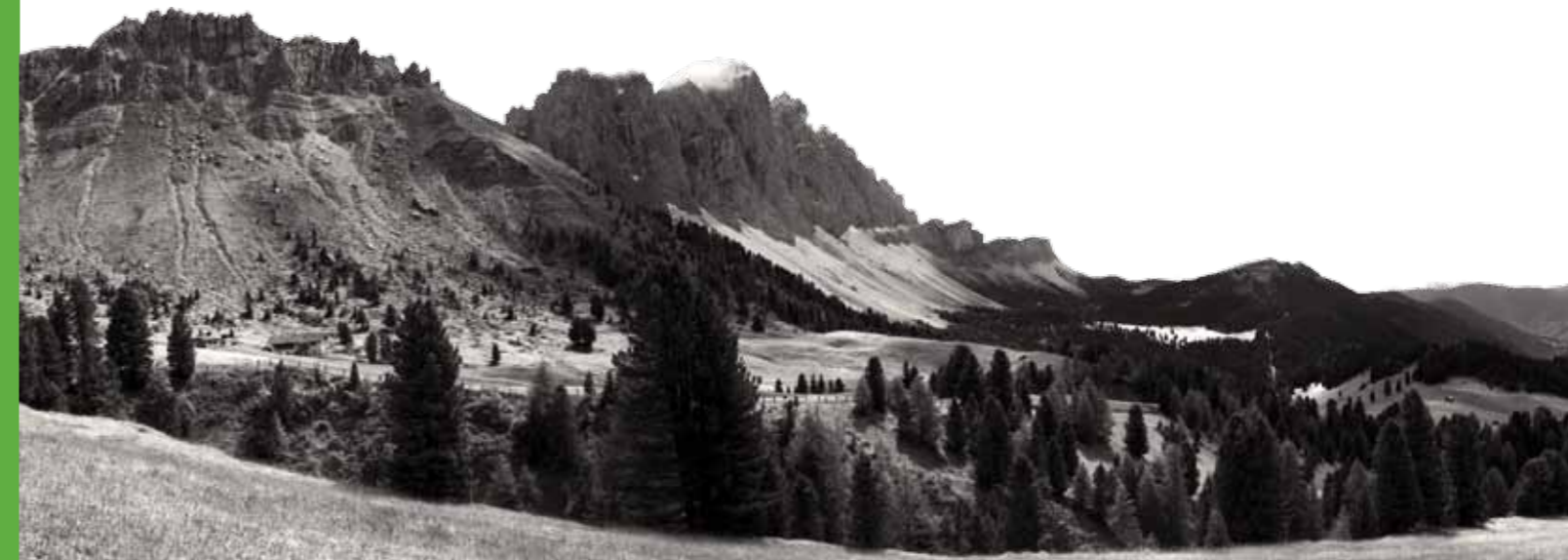
Matteo Cortese - La scala universale, 2011 - Parco naturale Puez-Odle