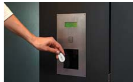
Alternativamente gli ospiti dell'hotel possono richiedere l'attivazione via citofono alla reception.