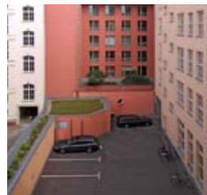
Sei posti auto convenzionali nel cortile posteriore dell'hotel.

Il Levelparker 570 era la soluzione tecnologica più appropriata dato che questo sistema è progettato in particolare per ottimizzare lo spazio in un sistema di file multiple su un unico livello. Vi è solo un'area di trasferimento vetture al livello del cortile dalla quale l'auto viene trasportata attraverso un elevatore verticale al livello di parcheggio. Lo spostamento delle auto avviene in gruppo tramite una procedura di controllo ciclico con movimenti longitudinali e trasversali delle piattaforme richiedendo due posti vuoti nel sistema.