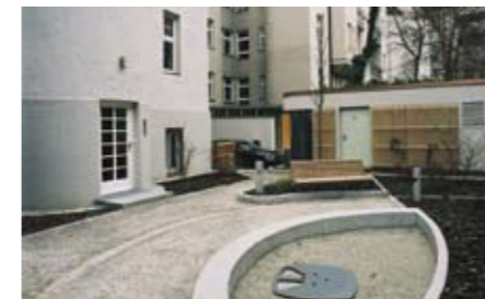
Immagine del cortile dove senza auto parcheggiate grazie al sistema Levelparker 590 i condomini hanno a disposizione un'area vivibile e libera.

L'applicazione di Monaco dimostra che la tecnologia non va a scapito delle ricchezze artistiche e culturali degli edifici dei centri città. Il Levelparker 590 in particolare può trovare ampie possibilità di installazione nei centri storici in quanto può essere adattato con flessibilità a specifiche esigenze progettuali. I livelli di parcheggio possono essere da 1 a 5 mentre il numero delle auto da parcheggiare varia da 10 a 50.