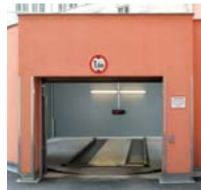
La porta si apre automaticamente e l'utente viene guidato da istruzioni su un display testuale.