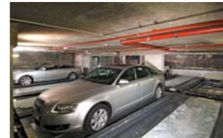
Viene fatta traslare verso l'elevatore con movimenti in sequenza