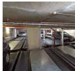
I posti auto sono posizionati in un sistema a 4 file una di fronte all'altra.