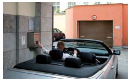
L'utente attiva la procedura di parcheggio tramite il suo chip induttivo al pannello di comando.