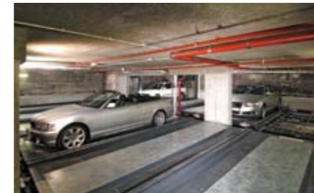
Una sequenza dura approssimativamente 28 secondi.