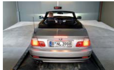
Scanner laser posti sul soffitto dell'area di trasferimento controllano il corretto posizionamento dell'auto.