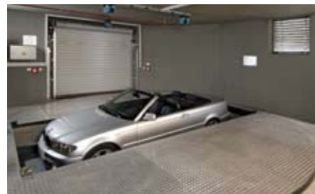
e poi viene fatta scendere.