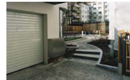
L'area di trasferimento delle auto situata nel cortile completamente rinnovato è perfettamente integrata all'ambiente circostante ed occupa poco spazio.