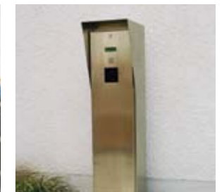
La selezione del posto auto avviene tramite chip induttivo al pannello di comando situato in prossimità dell'area di trasferimento.