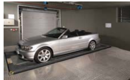
Dato che l'area di trasferimento è posizionata ad un'angolazione di 90° verso il livello di parcheggio, l'auto viene girata di 90°