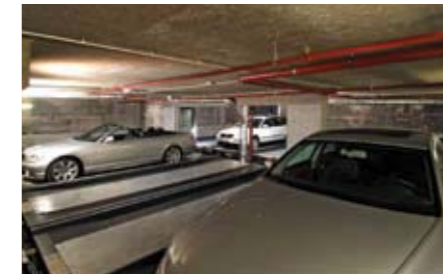
fino alla posizione dell'elevatore.