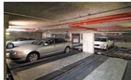
La Volkswagen bianca è stata selezionata per l'uscita.